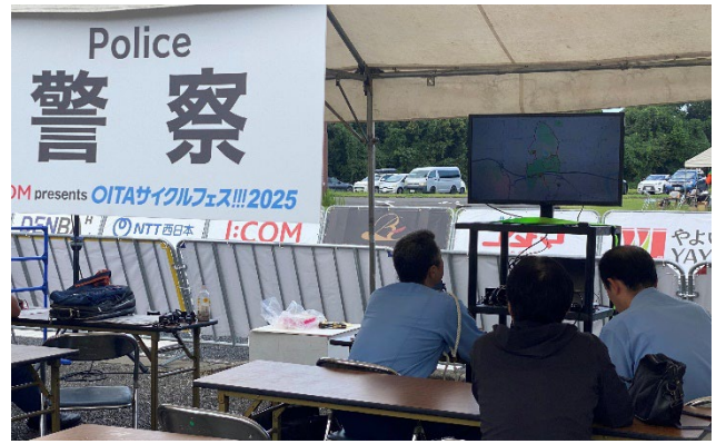
(運営車両の走行位置を確認：運営本部)