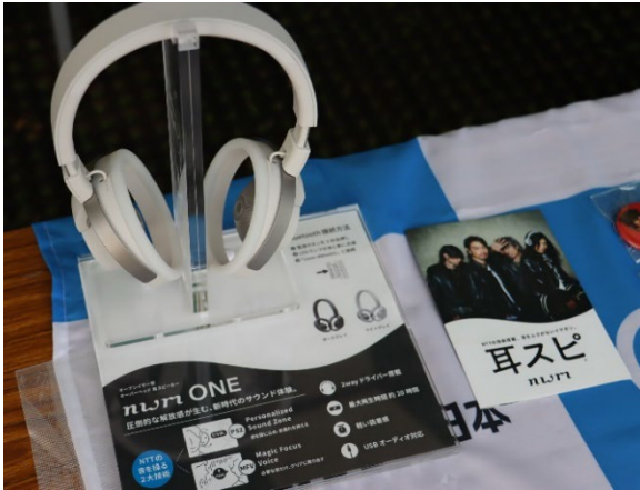
(オーバーヘッドタイプの「nwm ONE」)