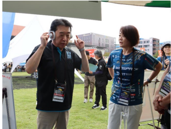
(足立大分市長も「nwm ONE」を体験)