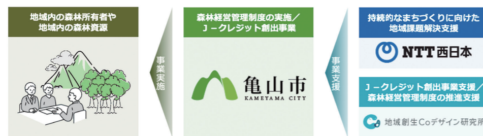
森林経営管理制度の推進に向けたJ-クレジット創出事業のイメージ

三重県亀山市では、市域の63%を占める森林のうち、手入れが行き届いていない民有林を対象に、市町村が森林所有者との仲介役となり、意欲と能力のある林業経営者に森林管理を委託する「森林経営管理制度」を活用した整備を進めています。市が管理者となり、2019年度から約131haの森林で間伐等を実施し、CO 2 吸収や水源涵養、木材供給等の多面的機能の維持を図っています。こうした森林整備の取り組みについて、NTT西日本 三重支店は、森林整備によって創出されたJ-クレジットの地域内外での活用を支援し、森林整備と経済活動を結びつける新たなしくみづくりに取り組んでいます。